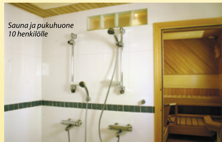
Sauna ja pukuhuone 10 henkilölle