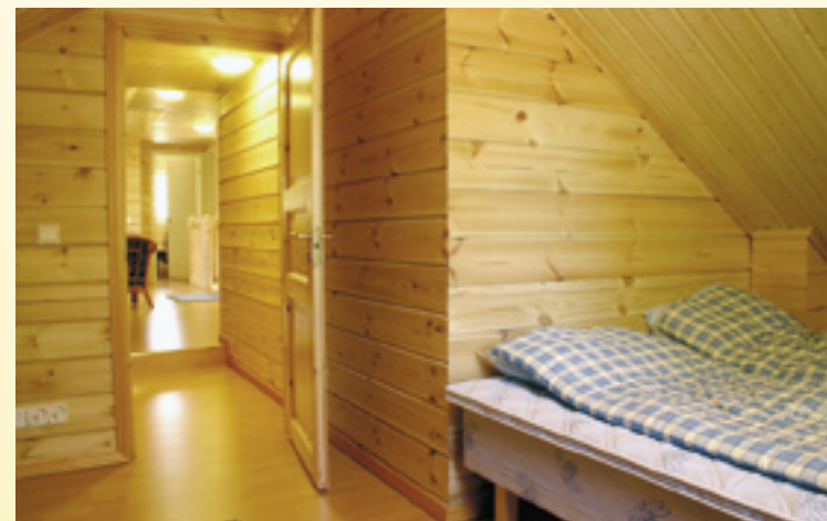
Ketahissa on viisi kahden hengen makuuhuonetta