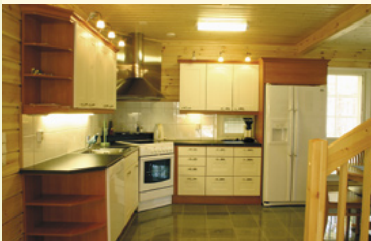
Keittiö vastaa hyvin varustetun omakotitalon keittiötä