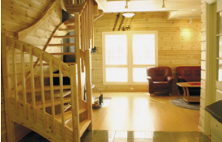
Alakerran aulatilat. Portaiden takana tunnelmallinen varaava takka

Alakerrassa on yksi makuuhuone, iso 10 hengen keittiö sekä olohuone. Varaava takka olohuoneessa tuo tunnelmaa ja lämpöä. Alakerrassa on myös kuivaushuone, wc sekä iso pesuhuone kahdella suihkulla. Sauna ja pukuhuone on 10 henkilölle. Talviaikaan sukset voidaan huoltaa erillisessä suksienhoituhuoneessa. Talossa on isot terassit etu- ja takapihalla.